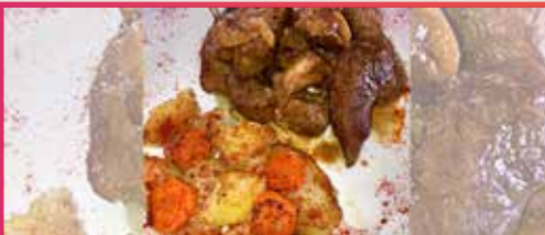
Jaja no!!! Que ha pasao