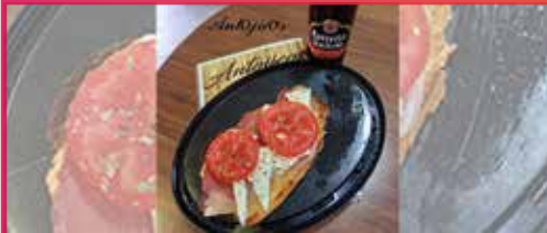
Tostá de lomo a la tabla