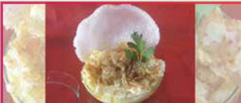
Esencia de Mar