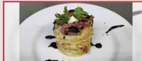
Torre de Carrillera