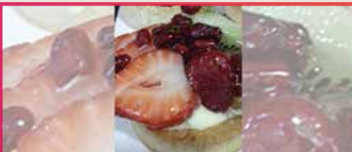
Tartaleta de Lima y Frutos Rojos