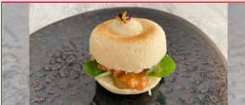
Brioche de presa Ibérica