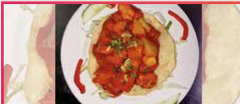
Mix chaat puri