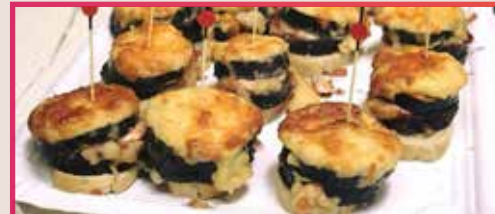
Pastel de Berenjena la Tasca