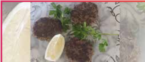
Bocado Exquisito de Catral