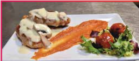
Solomillo con salsa de champiñones