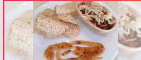
Chilli con carne en barquitas con queso curado y nachos