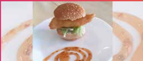
Bacalao rebozado sobre pan con salsa dulce