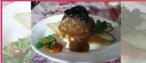
Tentación el Anguila